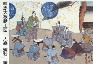
(本陣跡地緑地に平成31年4月完成)